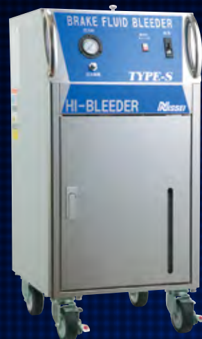
BB-1000RNS / BB-910RNS / BB-920RNS

最新のブレーキシステムでは管路が狭く、油圧系統が複雑化しているため、配管抵抗が高くなっています。新型ハイブリーダーは圧送ポンプを従来の1.5倍にパワーアップ。さらにスムーズなブレーキフルード交換を実現します。大型トラック等のプースタークラッチのエア抜き作業もよりスムーズに行えます。